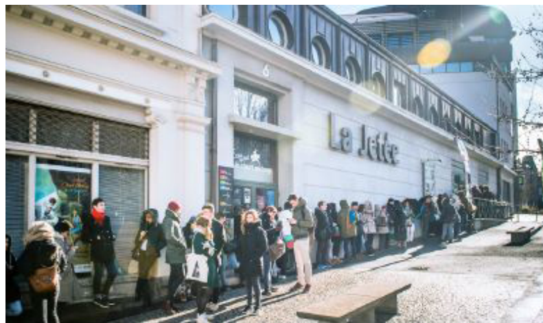
La Jetée © clermont-filmfest.org.